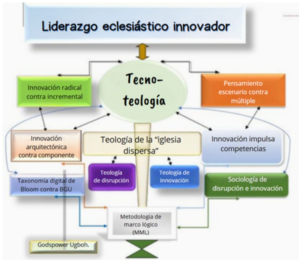
Figura 2: Marco conceptual para la tecno-teología 19

Anclar su investigación en marcos conceptuales relevantes le ayudará a crear la columna vertebral conceptual del proyecto. Los “muros” que rodeaban el tabernáculo llevaban a una hermosa cortina, que cubría la entrada al atrio. 18 Este es un ejemplo de un marco conceptual para una monografía sobre el tema de la tecno-teología (Figura 2).