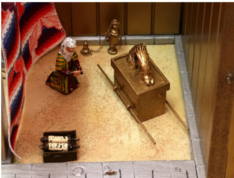
Figura 5: El Lugar Santísimo (utilizado con el permiso de Frederic Travier)