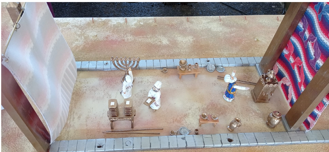
Figura 4: El Lugar Santo

Durante el proceso de recopilación y análisis los investigadores obtienen datos del campo o de sus lecturas en su área específica de investigación. En esta etapa es fácil enfrascarse en tecnicismos y olvidar las múltiples maneras en las que Dios revela aspectos de su gloria en las comunidades bajo investigación. Mantener una comunión cercana con el Señor y practicar disciplinas espirituales son de vital importancia durante esta fase de la investigación.