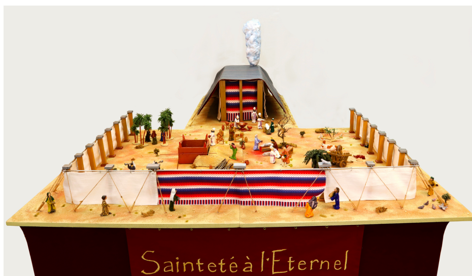
Figura 1: Panorama general del tabernáculo

Estas reflexiones utilizan la metáfora del tabernáculo en el desierto como un marco vivo y convincente para ayudar a los investigadores cristianos a formar sus proyectos. En Hebreos 10:19-22, el autor de la carta hace referencia al antiguo tabernáculo del desierto o al familiar templo hebreo. Estas estructuras, simbólicas del llamado de Dios al culto, no sólo sirven de representaciones visuales sino también les ofrecen a los investigadores cristianos un marco detallado para investigar como un acto de adoración a Dios. Para agilizar esta reflexión, se enfocará solamente en la metáfora del tabernáculo.