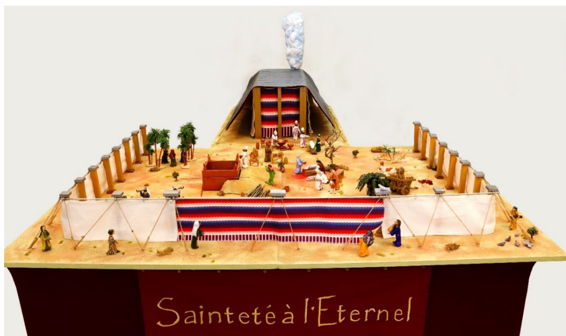
图一:会幕全貌

以下的反思借鉴旷野中的会幕作比喻,为基督徒研究者提供了一个生动而有说服力的框架以塑造其研究工作。在希伯来书十章19-22节中,书信的作者提及古老的旷野会幕或人们熟悉的希伯来圣殿。此结构象征着神要人敬拜,不仅提供了直观的表现形式,还为基督徒研究者提供了丰富的框架,使其能将研究作为敬拜神的行动。为简化思路,我们将只关注会幕的比喻。