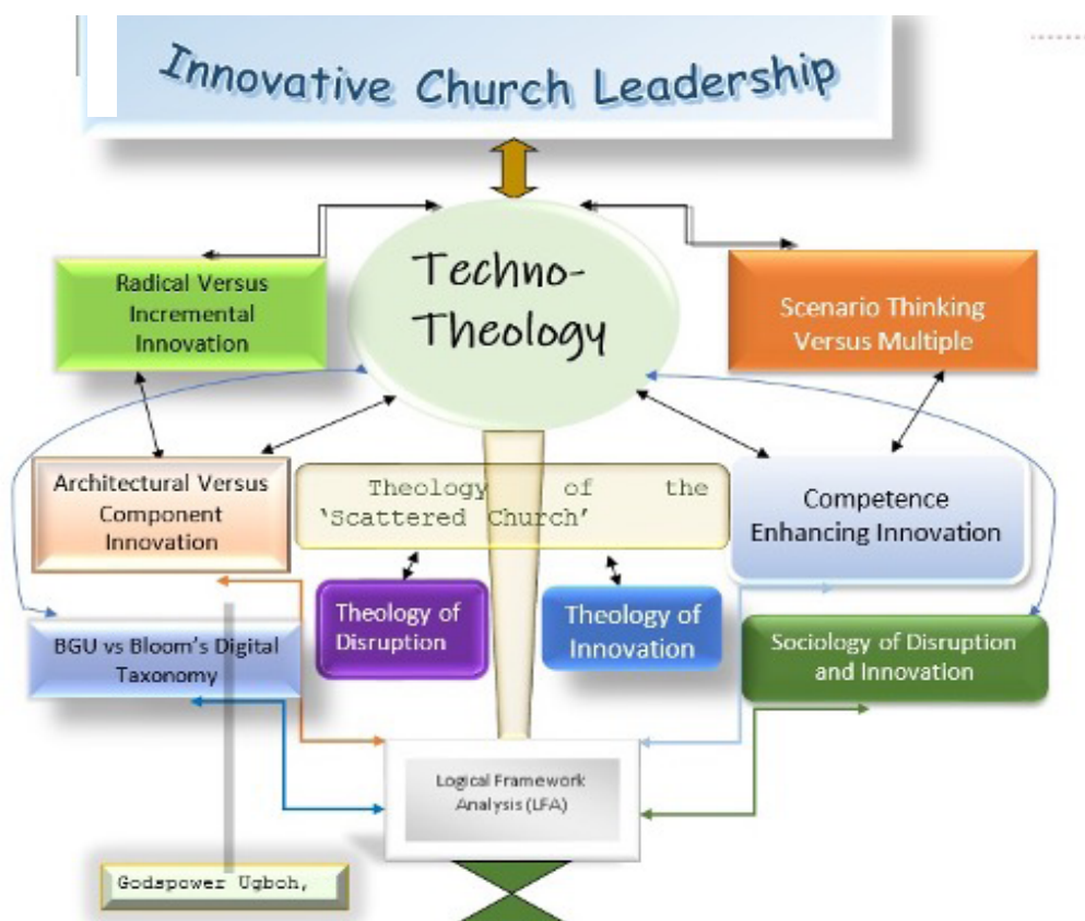
圖二:技术神学的概念框架 19

反思:或许现在是你绘制概念图或彩色图表的时候,来展现不同的概念框架和研究目标如何相互联系。