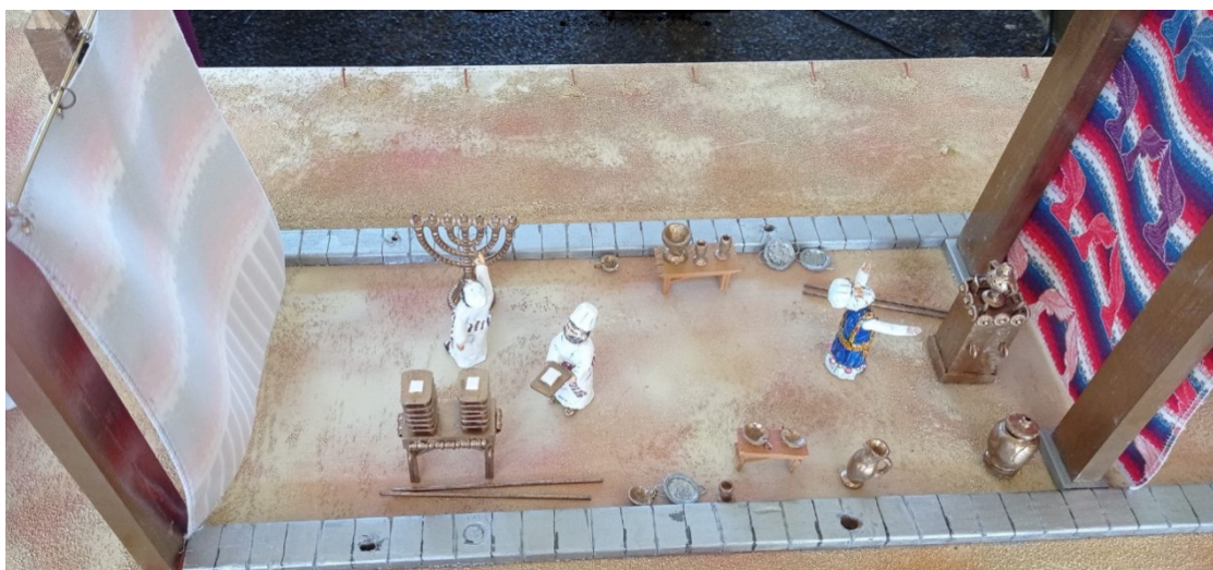
图四:圣所

资料收集和分析过程,是研究者从实地或其特定研究领域的阅读中获取资料的过程。在这过程中,很容易沉迷于技术性问题,而忘记神在所研究群体中多样彰显其荣耀的方式。在这个研究阶段,与主保持密切交通和操练灵性是至关重要的。