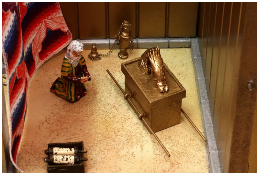
图五:圣所

越过香坛,穿过香坛后面的幔子,我们现在站在神最神圣的居所——至圣所的门槛上,神的神圣存在被揭开,并以人的角度被理解。其核心圣物约柜在圣经中共有180处被提及,占有无与伦比的重要地位。希伯来书九章3-5节详细描述了约柜中的物品,其中有有盛吗哪的金罐、亚伦发过芽的杖,并神在西奈山顶赐给摩西的两块约版(来五3-5)。